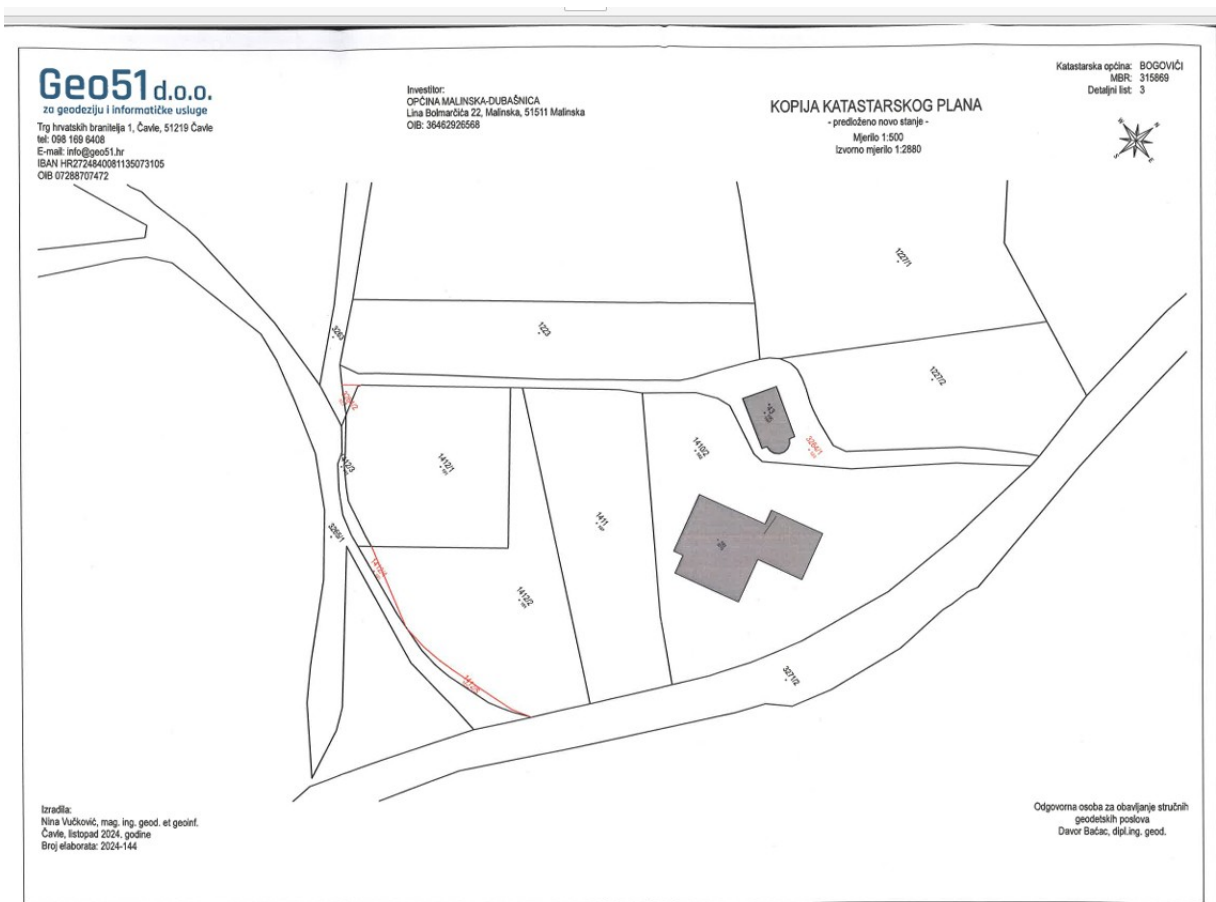
Slika 2. – Situacija iz Geodetskog elaborata

Budući da je dio zemljišta koji se ustupa Adriani Georgeti Mamut upisan kao javno dobro u općoj uporabi u neotuđivom vlasništvu Općine Malinska-Dubašnica, prije raspolaganja istim potrebno je ukinuti status javnog dobra na novoformiranoj katastarskoj čestici, odnosno dijelu čestice koji više nije potreban za opću uporabu, opisanom kao k.č. 3263/2 k.o. Bogovići, put od 7 m 2 . Nakon provedbe ove Odluke u zemljišnim knjigama predmetna nekretnina moći će biti predmet daljnjeg raspolaganja sukladno propisima kojima se uređuje upravljanje i raspolaganje nekretninama u vlasništvu jedinica lokalne samouprave.