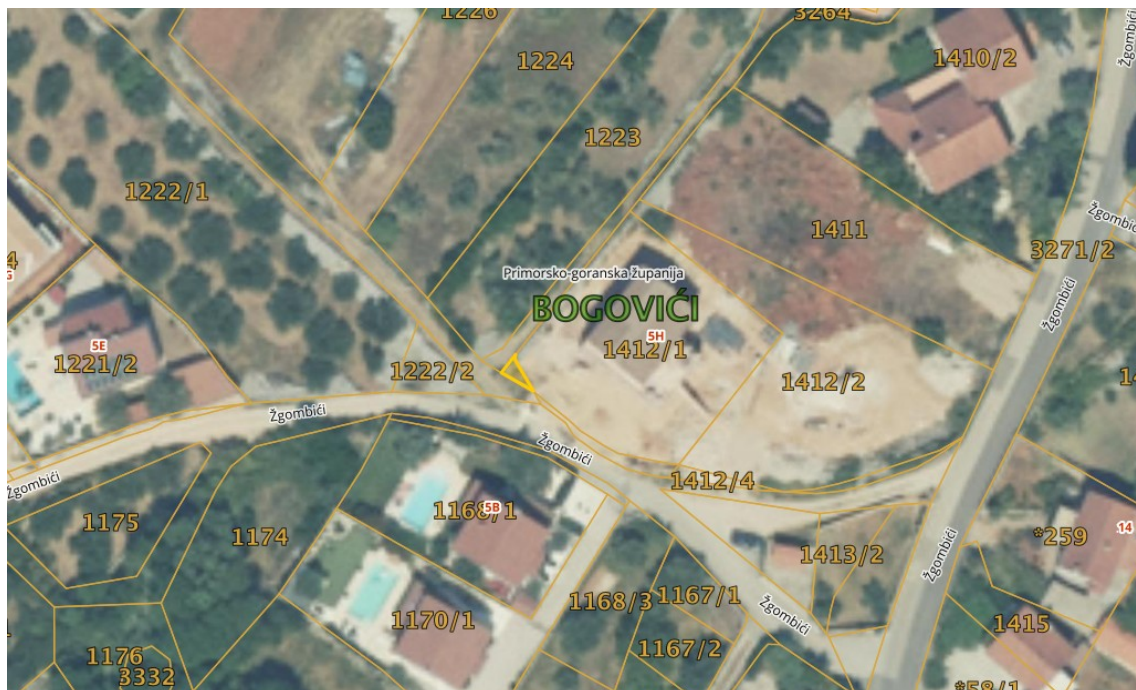
Slika 1. – Ortofoto/DOF

Predlaže se Općinskom Vijeću Općine Malinska - Dubašnica donošenje Odluke o ukidanje statusa „JAVNO DOBRO U OPĆOJ UPORABI U NEOTUĐIVOM VLASNIŠTVU OPĆINE MALINSKA-DUBAŠNICA, OIB: 36462926568, MALINSKA, LINA BOLMARČIĆA 22“ za k.č. 3263/2 k.o. Bogovići, upisanu u z.k.ul. 11954 kod Općinskog suda u Crikvenici, Zemljišnoknjižni odjel Krk, površine 7 m 2 , u svrhu zamjene nekretnine a budući da je trajno prestala potreba za korištenje navedene nekretnine kao nerazvrstane ceste.