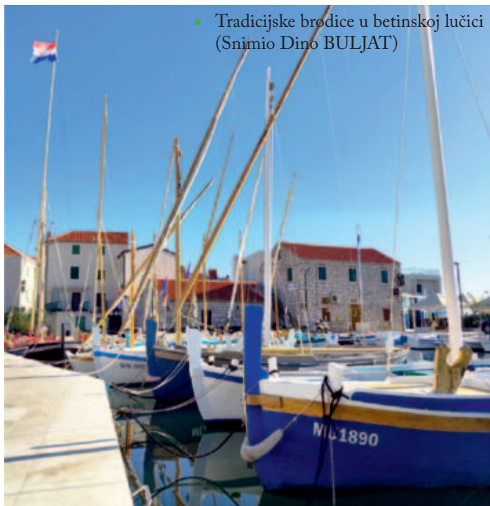
■ Tradicijske brodice u betinskoj lučici

Prva od tih konferencija, možda nama i najdraža, s obzirom na njezin maritimni predznak, bila je 2. Konferencija o očuvanju i interpretaciji pomorske baštine Hrvatske, održana u Betini 26. i 27. rujna. Upravo je lokacija konferencije bila savršena kulisa i za naše izlaganje o problematici brodica u lukama kao vanjskih postava maritimnih muzeja i centara. Naime, tko god je u Betini bio, zna da njezinu lučicu ukrašava dvadesetak prekrasnih drvenih brodica tradicijskih linija, uglavnom gajeta i leuta izrađenih u obližnjim škverovima čiji majstori već stoljećima pažljivo vuku te iste linije. Izazvao je taj prizor veliko oduševljenje u nama, kao što bi kod svakog ljubitelja pomorske baštine, ali poslužio je i kao gorak podsjetnik na problem našega vanjskog postava i naših tradicijskih barki , koje su umjesto ispred DUBoaka sada raštrkane po malinskarskoj luci. U nadi da će se one čim prije vratiti tamo