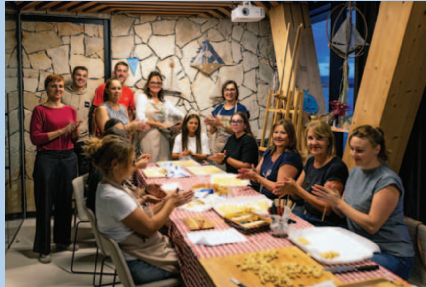
▪ Radionice – izrade šurlica...

Izložba Leta pasuju, tradicija ostaje. Tako je 14. rujna na krovu DUBoaka, pod otvorenim nebom otvorena izložba te su izložene stare fotografije prizvale tihi šapat prošlosti. Gledajući u njih, čovjek shvati koliko smo dužni svojim precima jer zahvaljujući njima danas znamo tko smo.