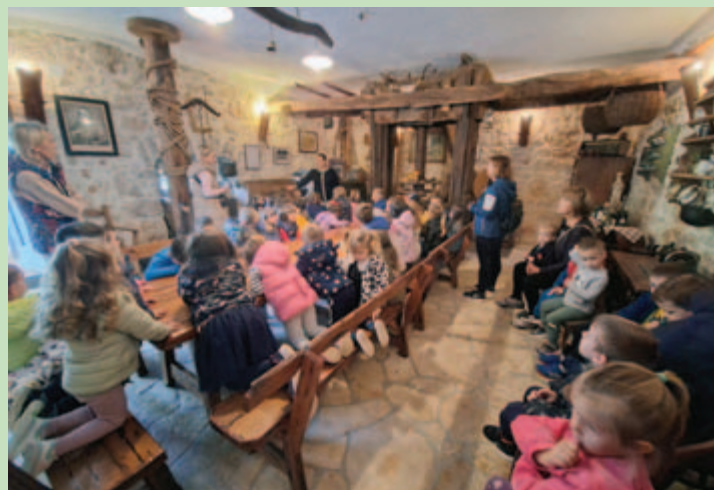
■ Mališani u Bogovskom tošu

Obilježeni su i Međunarodni dan tolerancije te Međunarodni dan dječjih prava, brojnim aktivnostima i igrama koje su djeci približile važnost međusobnog poštovanja, razumijevanja i zajedništva.