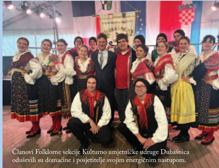
Članovi Folklorne sekcije Kulturno umjetničke udruge Dubašnica oduševili su domaćine i posjetitelje svojim energičnim nastupom.

Posebno želimo pohvaliti naše mlade iz Folklorne sekcije, koji nas već godinama prate na ovakvim putovanjima i s ponosom predstavljaju našu Općinu. Njihova predanost, energija i ljubav prema tradiciji uvijek impresioniraju domaćine i sudionike susreta, te su s vremenom postali nezaobilazan dio tih međunarodnih druženja.