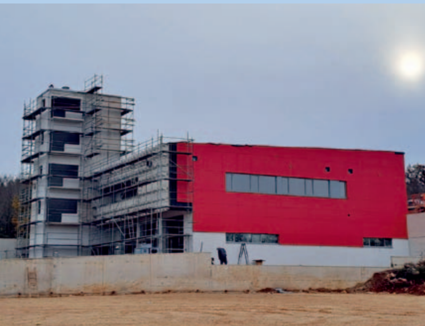
▪ Pogled sa zapada na Vatrogasni dom u izgradnji

Već sada najavljujem velike građevinske radove po cestama i klancima na području Sv. Antona. Naime, upravo sam saznao da smo kroz Ponikve voda d. o. o. od Ministarstva zaštite okoliša i zelene tranzicije za izgradnju fekalne odvodnje dobili milijun eura poticaja, ali je rok za izvedbu toga velikog projekta za kojeg ćemo morati dodati još barem polovinu dobivenog iz općinskog Proračuna, veoma kratak. Naime, prvotni uvjet natječaja bio je da projekt izvođenja kanalizacije Sv. Antona moramo završiti do listopada sljedeće proračunske godine što bi značilo da ćemo morati graditi i za vrijeme ljetne stanke. Nastojali bi svakako da barem za vrijeme „špice“ prestanemo s bučnim radovima, iako je već sada vidljivo da po dinamici radova cijeli lipanj i prvi dio srpnja najvjerojatnije ne bi mogli izbjeći radove. Stoga već sada najavljujem onima koji