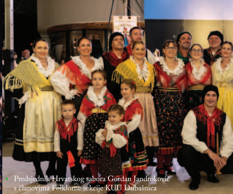
▪ Predsjednik Hrvatskog sabora Gordan Jandroković s članovima Folklorne sekcije KUU Dubašnica

Okrugli stol – razgovor o budućnosti identiteta. Na okruglom stolu Folklor danas – održivost i relevantnost tradicije , istaknuto je ono najvažnije: folklor nije zabava, folklor je politički, kulturni i društveni čin očuvanja identiteta naroda.