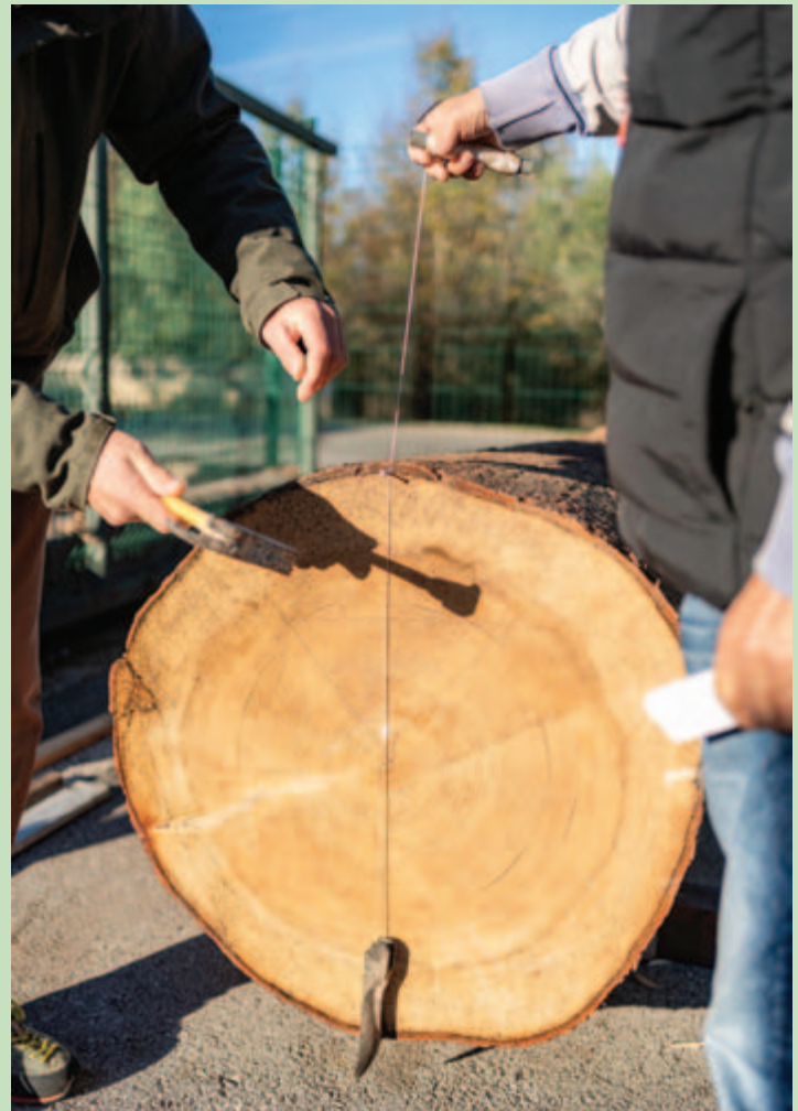
■ Označavanje budućih linija ladve

Ne zna se točno kada su se ladve pojavile na prostoru otoka Krka, no pouzdano se zna da su se u Dubašnici koristile sve do sredine 20. stoljeća. Upravo je ladva, sačuvana u franjevačkom samostanu u Portu, središnji eksponat Interpretacijskog centra maritimne baštine DUBoak. Posebno je značajno da su na području kvarnerskog bazena sačuvane tek četiri ladve – a iznimnost leži u činjenici da su sve izrađene i korištene upravo u Dubašnici.