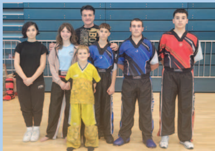
■ Članovi KBK Malinska na Prvenstvu Kickboxing saveza Primorsko-goranske županije u Kostreni 25. listopada

U Kostreni je 25. listopada održano Prvenstvo Kickboxing saveza Primorsko-goranske županije. KBK Malinska je nastupila sa šest natjecatelja u dvije discipline. Oni su imali sedam nastupa i vratili su se na otok Krk s pet medalja (tri srebra i dvije bronce). To je vrlo dobar rezultat budući da su njih četvero imali svoje prve borbe u životu.