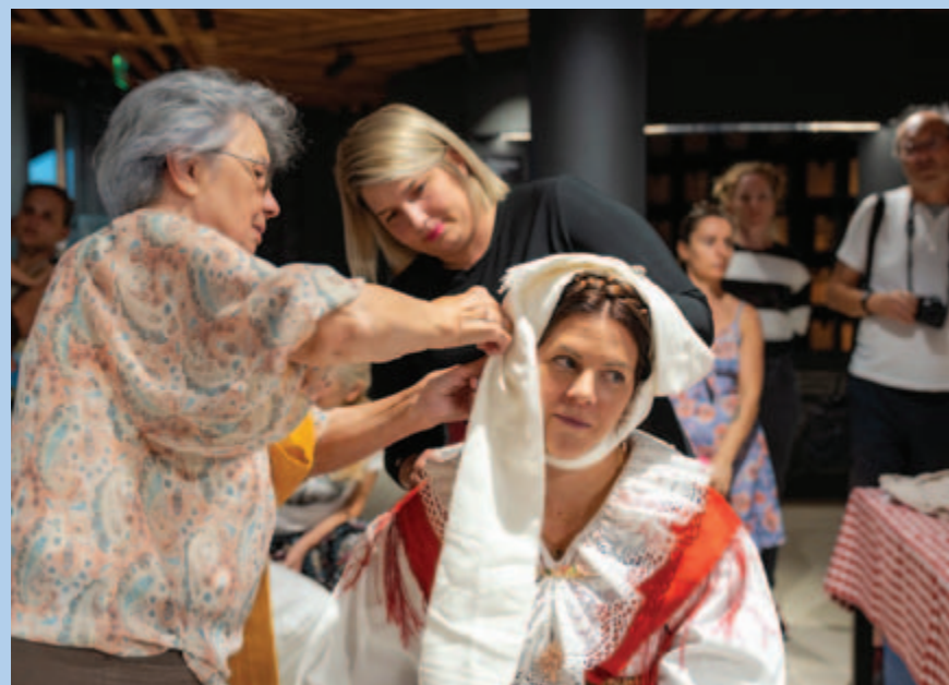
▪ ...i vezanja ruba

U tim malim, preciznim gestama skriva se duša našeg naroda: strpljivost, vještina i ljubav prema detalju.