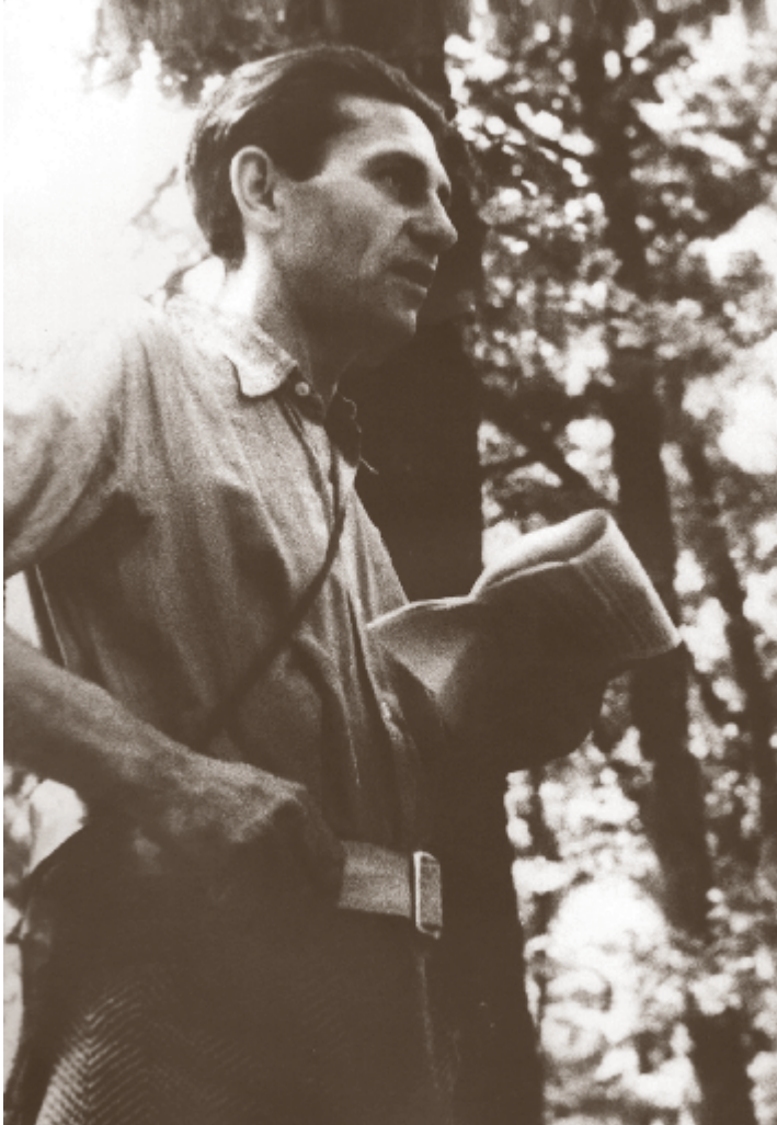
■ Kazimir Ostrogović tijekom I. kongresa kulturnih radnika Hrvatske u Topuskom 1944. godine

Rođen u mnogočlanoj obitelji na tada ne previše prosperitetnom otoku Krku, Ostrogović kao dijete odlazi živjeti u Koprivnicu gdje skrb o njemu preuzima lokalna grofovska obitelj. Već kroz djetinjstvo je pokazivao iznimnu preciznost i fokusiranost u onome čime se bavio, a 1927. godine odlazi u Zagreb na studij arhitekture. Prva praktična iskustva, ali i važna poznanstva stječe kao suradnik u birou Stanka Kliske s kojim radi na natječaju i realizaciji Banovinske bolnice na Sušaku (danas KBC Sušak), a ubrzo zatim, 1935. godine, otvara i privatnu praksu. Prvi realiziran projekt, koji uz određene izmjene i danas stoji na istom mjestu, mu je Vila Koch u Malinskoj (uvala Cukličevo!). Značajno „terensko“ iskustvo stječe u razdoblju od 1937. do 1941. godine kada vodi stručni nadzor nad gradnjom Hrvatskoga kulturnog doma na Sušaku, a ranije navedene povijesne mijene zatim ga odvođe u talijanske zatvore u Rijeci, a dolaskom Nijemaca i u partizanski pokret. Tamo ubrzo postaje jedna od ključnih figura u organiziranju struke i kreiranju arhitektonskih politika u budućoj državi, što će mu kasnije osigurati status jednog od najutjecajnijih, ali i najpopularnijih arhitekata.