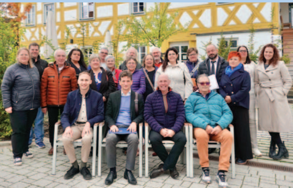
■ Predstavnici općina Grosshabersdorf, Świąciechowa, Aix-sur-Vienne i Malinska-Dubašnica

posjetitelje svojim energičnim nastupom. Posebno je istaknuto kako je iznimno vrijedno vidjeti mlade uključene u takva međunarodna događanja.