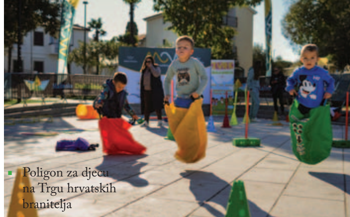
■ Poligon za djecu na Trgu hrvatskih branitelja