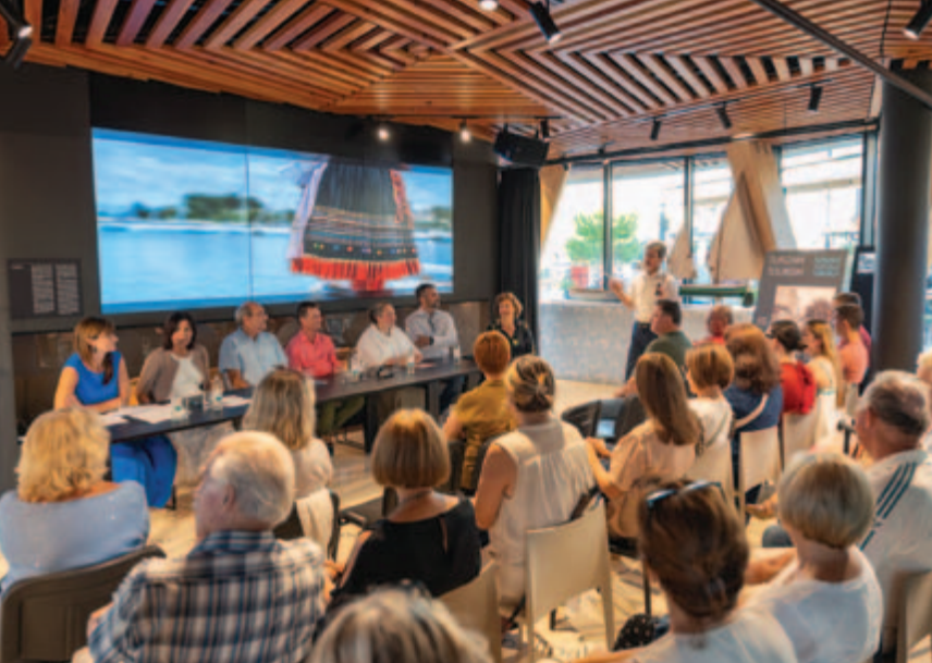
▪ Sudionici okruglog stola Folklor danas – održivost i relevantnost tradicije