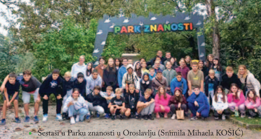
▪ Šestaši u Parku znanosti u Oroslavlju