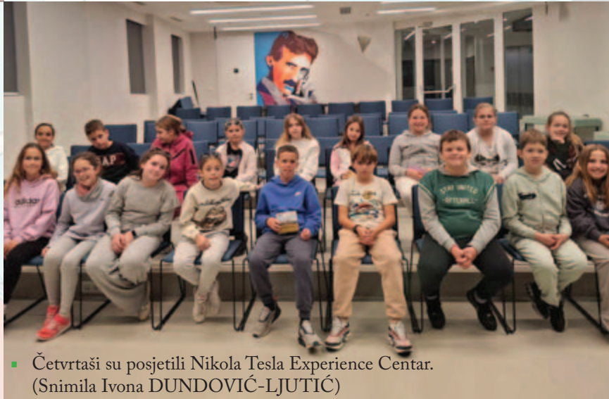
▪ Četvrtaši su posjetili Nikola Tesla Experience Centar.

Početkom listopada, učenici drugih i trećih razreda proveli su dva sunčana jutra u šetnji Malinskom i posjetu Interpretacijskom centru maritimne baštine DUBoak. Ondje su učili o čvorovima, hrastu (dubu), drvenim tradicijskim barkama, o moru i folkloru.