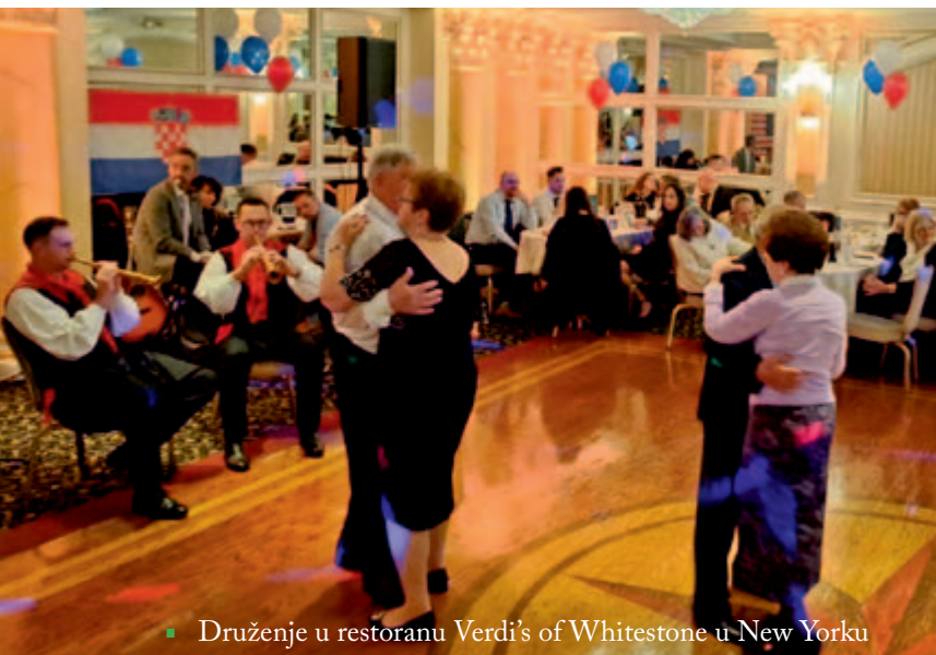
▪ Druženje u restoranu Verdi's of Whitestone u New Yorku

Ne samo da klub živi i postoji i nakon dugih 75 godina te sada već davne 2015. godine kao i sada s punih 85 godina od formiranja kluba 1940. godine u New Yorku, nego se prenosi i na mlađe naraštaje Dubašljana u SAD-u.