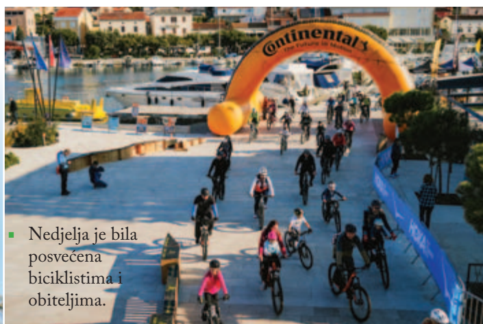
■ Nedjelja je bila posvećena biciklistima i obiteljima.