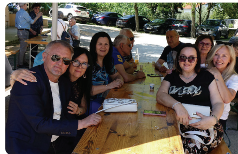
Naši župljani okupljeni u zajedništvu i uskrсноj radosti.