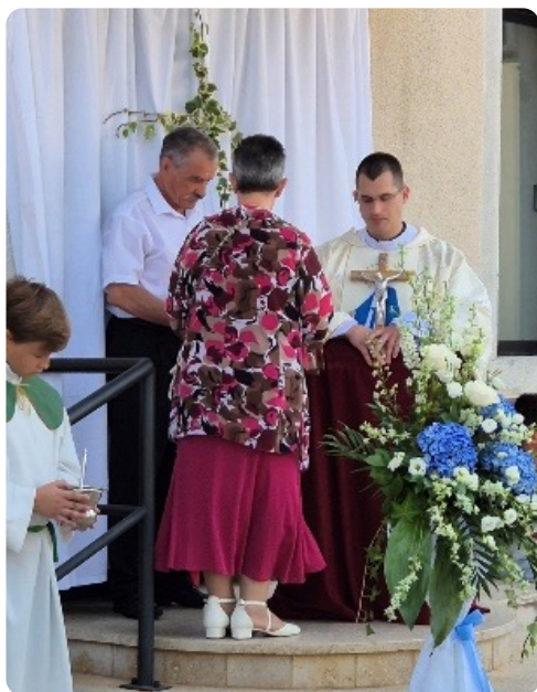
Roditeljski blagoslov ispred OŠ u Dubašnici