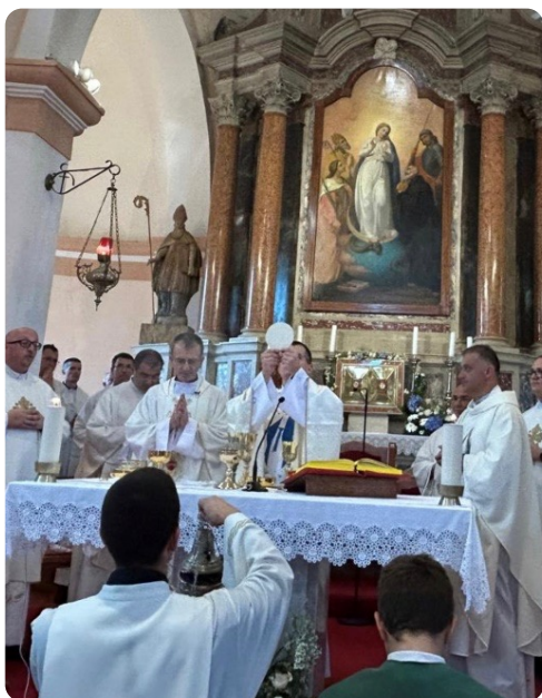
Trenutak euharistijske pretvorbe u Misi.