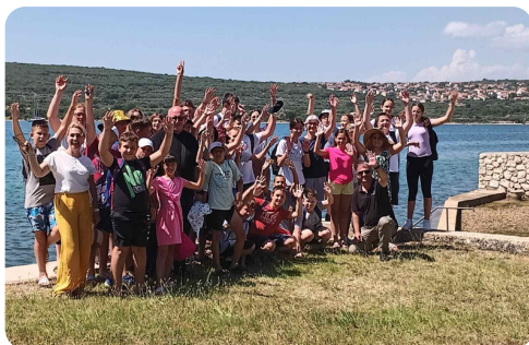
Zajednička slika nakon kupanja

iz zemlje". Zatim smo slavili svetu Misu koju je animirao dječji zbor a tijekom koje je vlč. Zoran cijelo vrijeme ispovijedao djecu. Nakon sv. Mise fra Nikica Devčić ispričao nam je svoju priču kako se odlučio postati fratar reda "Manje braće". Zatim smo išli na kupanje na plaži koja se nalazi u dvorištu samostana. Djeca su ovaj trenutak dočekala s velikom radošću. Brižne majke su pazile na red i djeci davale sendviče i sokove. Nakon kupanja otišli smo u restoran/pizzeriju Ragusa u Puntu gdje smo lijepo zajednički blagovali ogladnjevši nakon bogatog sadržaja tijekom dana. Bogu hvala sve je proteklo u redu i zajedništvu te smo se u poslijepodnevnim satima vratili u našu Dubašnicu. M.H.