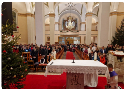
Sa "dječje Polnočke"