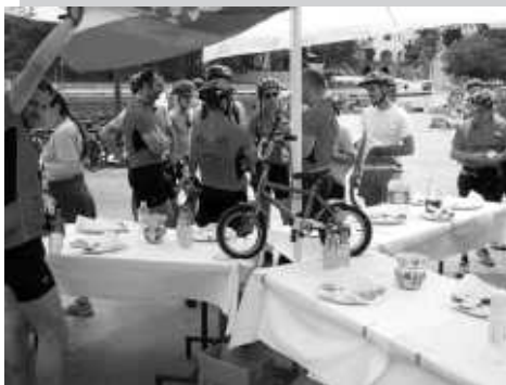
Biciklisti su se okrijepili u Portu

Veliki doprinos biciklijadi dali su i sponzori Radio OK, Radio Maximum, Jamnica d.d, Hotel Malin, Frajona, Konoba Porat, EL-TE-KI i Zrilić commerce.