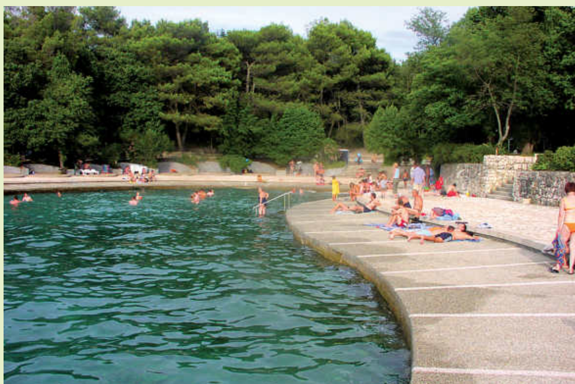
... i danas