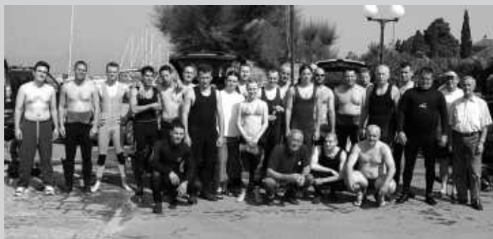
U čišćenju malinskarskog podmorja sudjelovali su ronionci iz Karlovca, Siska, Rijeke i Njivica.