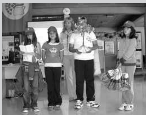
Ove smo se godine predstavili dubom izrađenim od recikliranog papira i otpadne žice.

Momčadi su prvo posjetile Ponikve d.o.o. - deponij na Treskavcu. Tu su im djelatnici pokazali kako izgleda prerada otpada u pogonima za reciklažu. Posjetili su i crkvu svete Lucije u Jurandvoru i vidjeli repliku Bašćanske ploče. Obišli su i kulturno-povijesne znamenitosti grada Krka.