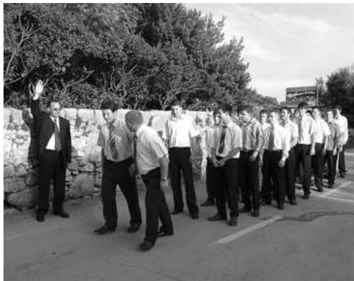
Uoči početka trčanja za sirom