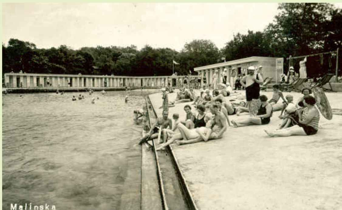
Haludovo – 1946. godine...