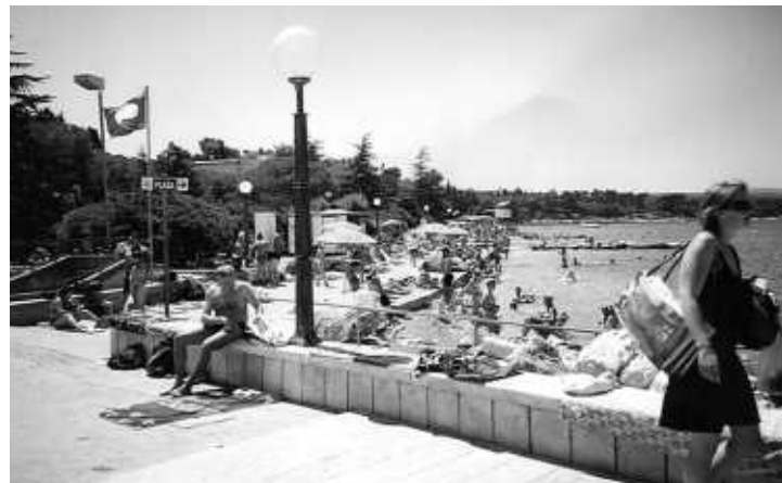
Plava zastava i ove se godine vijori na malinskarskoj plaži Rupa

Tijekom srpnja Turistička zajednica općine Malinska dostavila je svakom iznajmljivaču dopis u kojem su infor-