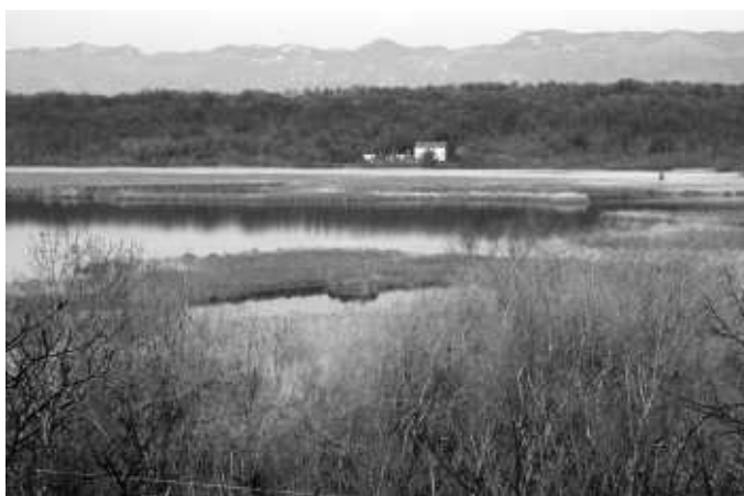
Jezero s rubnim zamočvarenim pojasom je jedna od najvažnijih prirodnih slatkovodnih oaza kvarnerskih otoka.

Druga, sa stanovišta zaštite prirode, veća slatkovodna akumulacija otoka Krka, dijelom umjetnog (antropogenog) postanka, je akumulacija Ponikve. Umjetni nastanak akumulacije nimalo ne umanjuje njezinu važnost za zaštitu prirodnog svi-