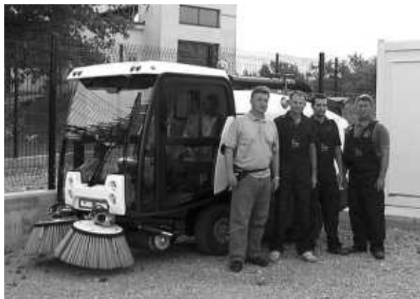
Djelatnici komunalnog društva s novom pometačicom

Popravljen je betonska obala u uvali Draga, (njezin podvodni dio) s novim stubištem i rukohvatom. Na kupalištu Haludovo betonirana je podloga na dijelu uništenog sunčališta i izbetonirana je nova kulir podloga; postavljeni su novi rukohva-